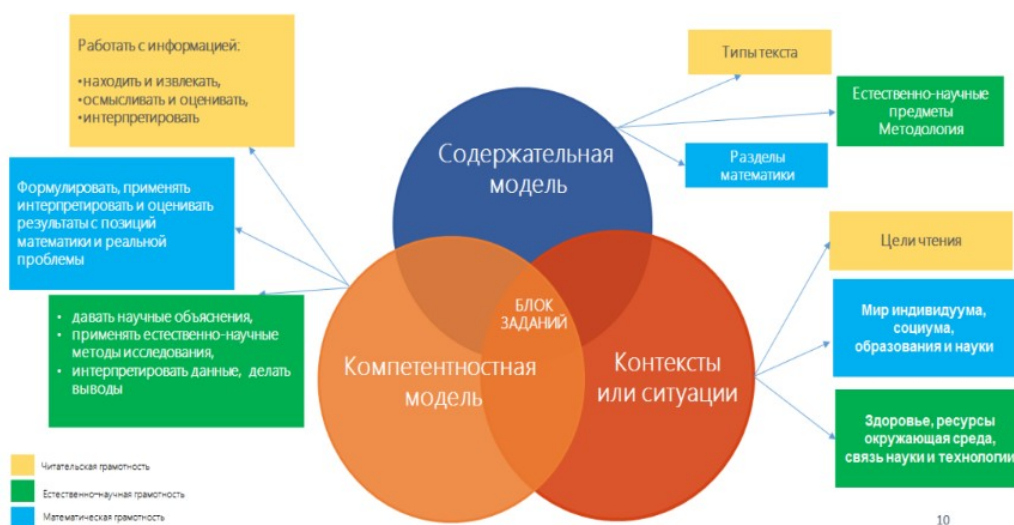
Рис. 1. Концептуальная рамка оценки функциональной грамотности в исследовании PISA

грамотности, естественно-научной грамотности и математической грамотности в исследованиях PISA представлена на рис. 1: