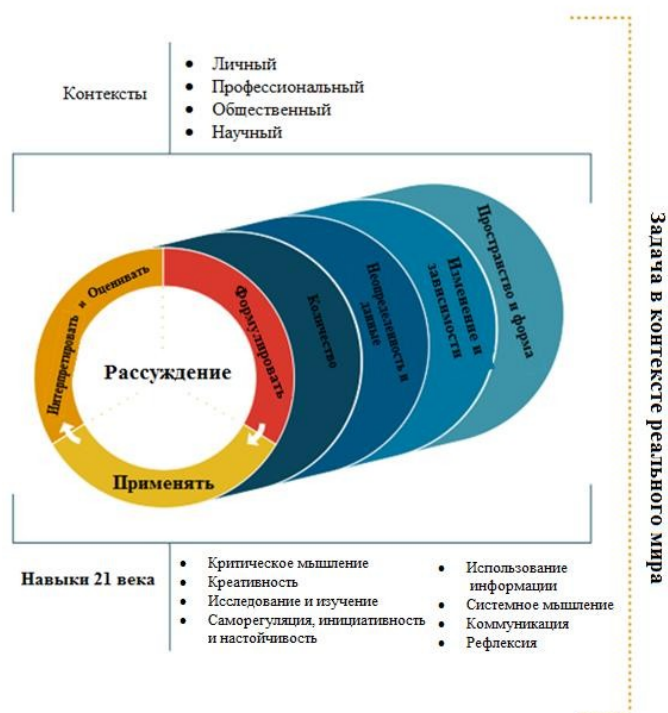
Рис. 2. Концепция направления «математическая грамотность» PISA

Согласно концепции по математике исследования PISA-2021(2022) – ключевой составляющей понятия «математическая грамотность» является математическое рассуждение. Концепция направления «математическая грамотность» исследования PISA представлена на рис. 2: